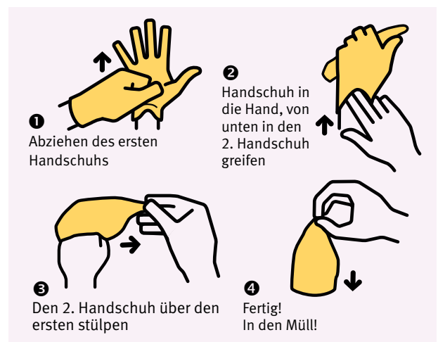
Grafik nach www.hygiene-beim-wickeln.de

Ungepuderte Handschuhe aus Vinyl oder Nitril werden oft besser vertragen als Latex-Exemplare. So oder so sollten Einmalhandschuhe nur über saubere und trockene Hände gezogen werden, um Ekzeme zu vermeiden. Einmalhandschuhe sind tatsächlich nur für den einmaligen, möglichst kurzen Gebrauch gedacht und müssen, sobald sie innen feucht geworden sind, gewechselt werden.