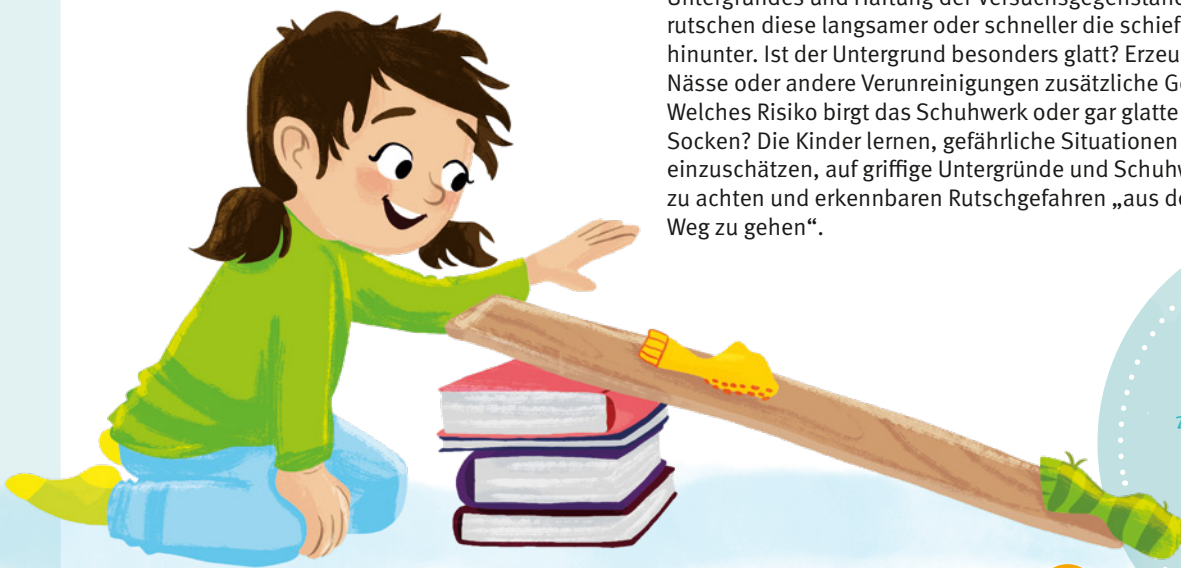
Illustration: Anna-Lena Kühler

Mehr Versuche aus der Reihe „Kinder forschen zu Prävention“ des Instituts für Arbeitsschutz der DGUV und der Unfallkasse Rheinland-Pfalz unter: www.dguv.de , Webcode: d104325