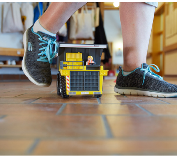
Herumliegendes Spielzeug lässt sich in Kitas nicht vermeiden, kann aber zur Stolperfalle werden.

www.sichere-kita.de > Leitung > Gefährdungsbeurteilung